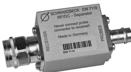
Einspeiseweiche: EW 7110 AC/DC separator: EW 7110